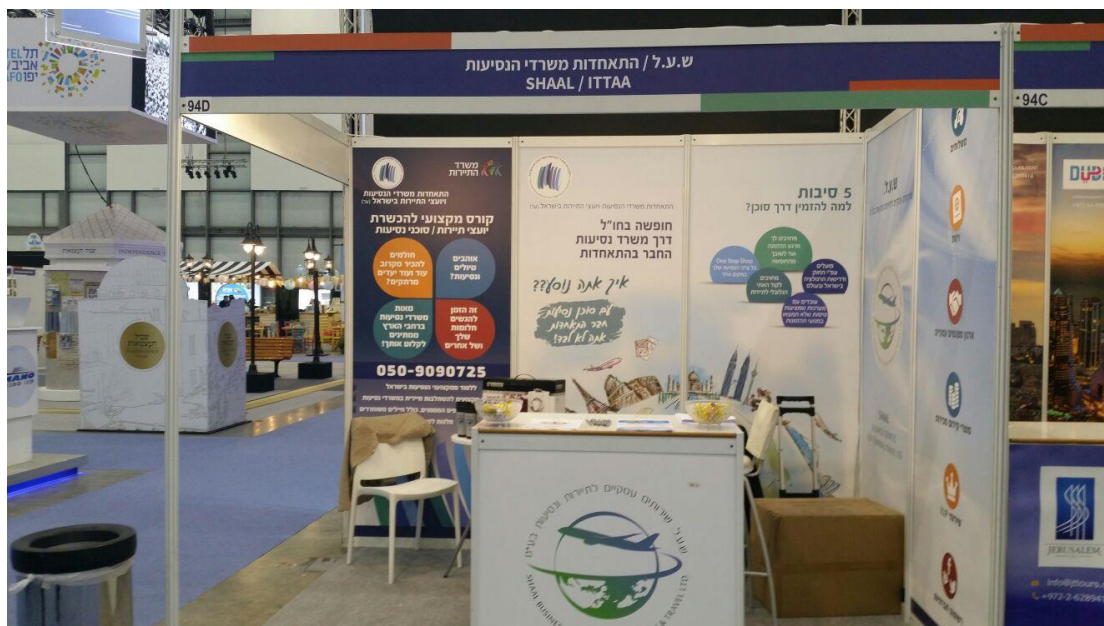
בתמונה: ביתן ההתאחדות וחברת ש.ע.ל. לפני הפתיחה – הזמן היחיד שהביתן היה ריק...